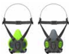
Maschere Semifacciali BLS 4000 S - BLS 4000R