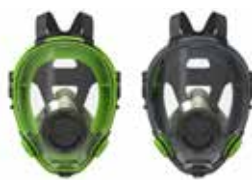
Maschere a Pieno Facciale BLS 5700 - BLS 5600